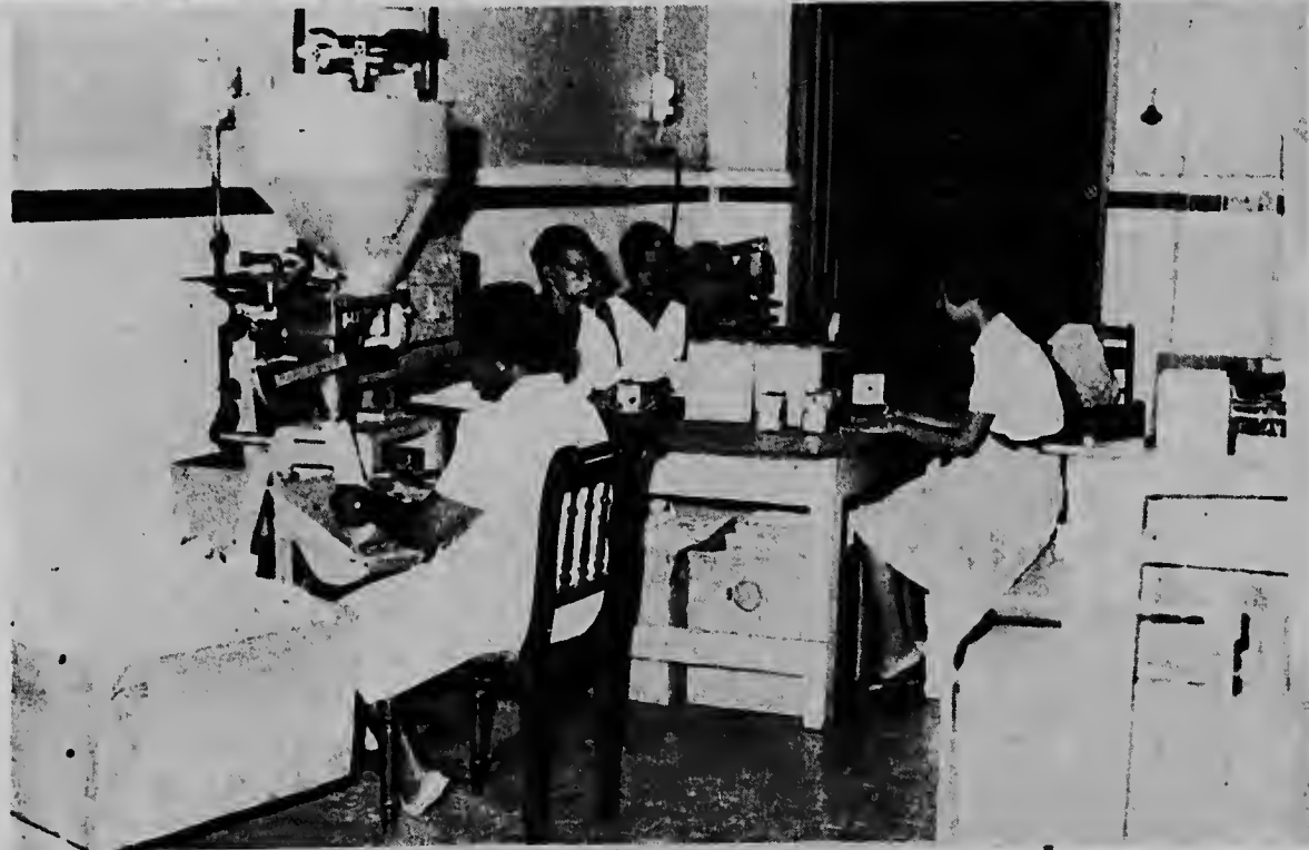
Riba e foto aki, nan ta pak kofie mulá. Por mira na man robey, a machin cu ta pisa e kofie automaticamente.

comercio di comestible, caminda supermercadonan ta ser construi den tur barrionan caminda e cantidad di habitantenan ta hustifica esaki, Empresa Hollandia a haña nan obligá di cuminsa cu envasenan di 1/2 liber y un liber di kofie, macaroni, spaghetti, aletria y elbows, propio pa e supermercadonan y pa tal fin a pidi varios machin especial pa empaquetá e productonan aki mientras qu empleadonan mester a ser entrena den e sistema nobo.